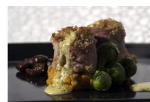
Öt fűszerrel grillezett szűzpecsenye fenyezett gesztenyével, sütőtökpürével bimbós kellel és juhfark sabayone