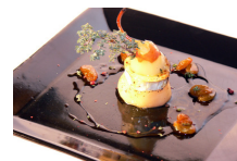
Mézzel rogyantott kakukkfűves körte kecskesajttal és szultánával