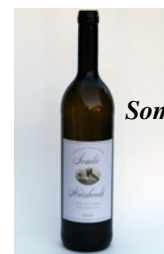
Somlói Hárslevelű 2001 2100.-Ft