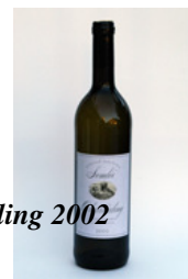
Somlói Olaszrizling 2002 2100.-Ft

A minap egy picike villányi bormanufaktúra termékeit kóstolhattuk. A pincészet neve Jackfall. A megkóstolt finomságok közül kettő különösen érdekesnek bizonyult. A 2003-as Grand két nemes bordeauxi fajta házasságából született. Édesanyja Cabernet Sauvignon, az apuka Cabernet Franc. Az ifjú Grand már most felülmúlja kortársai tekintélyes hányadát. Kiváló savakkal, erős, erőtlen alkoholtartalommal és remek tanninokkal megáldott bor, bár igazi csúcsmáját két éven belül éri el. A másik különlegesség a 2005-ös Duett, mely Cabernet Sauvignonból, Cabernet Francból, Kékfrankosból és Portugieserből keveredett szép kerek egészé. Lényegesen karcsúbb testű, mint testvére. Érdekesége aromáiban rejlik, melyek közt megtalálhatjuk a ribizlit, szedret, bazsalikomot, felfedezhetjük az animalitást és az ánizs illatát is. Ha egyedi ízekre, különlegesen jó minőségre és nem tömegtermékekre vágyunk, akkor ezek a borok kétség kívül megérnek egy kóstolót. Ennek a dinamikus fejlődő pincészetnek a termékei egyelőre igazi ritkaságnak számítanak.