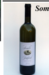
Somlói Juhfark száraz 2004.